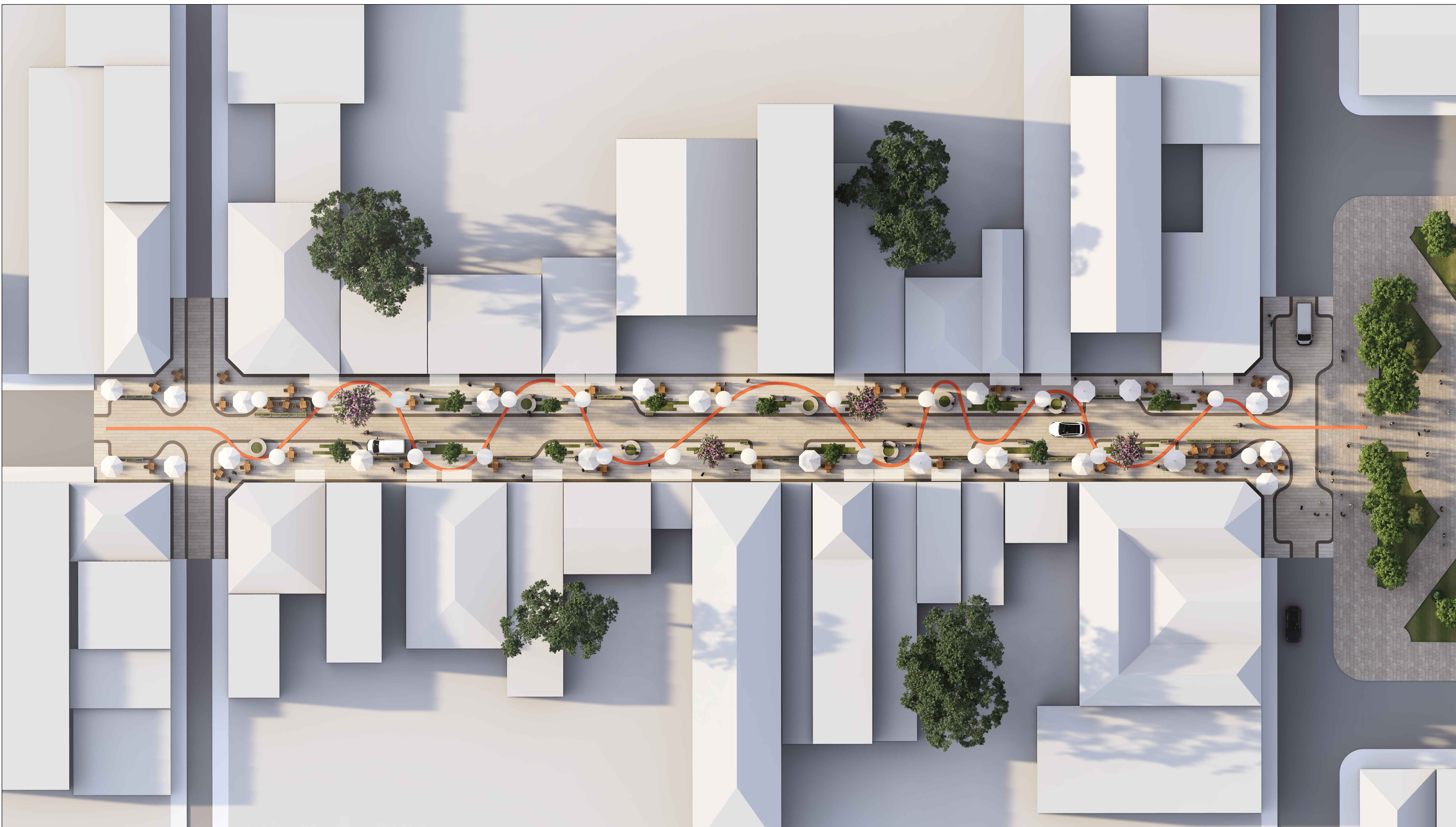
IMPLANTAÇÃO - GERAL - render SEM ESCALA